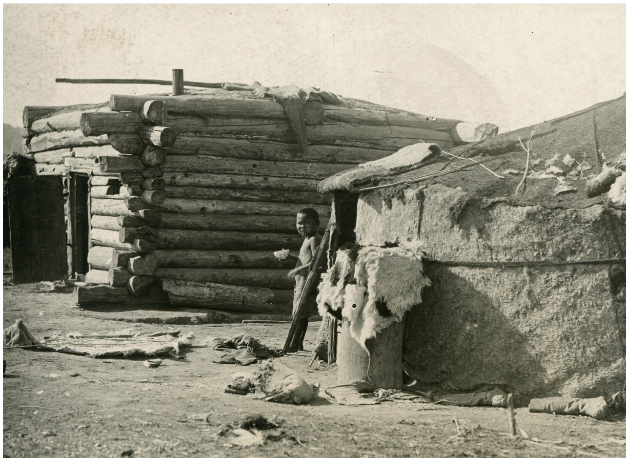
Фото 2. Аратское хозяйство, имеющее войлочную юрту и деревянную избушку, г. Шагонар, ТНР. 1930 г.