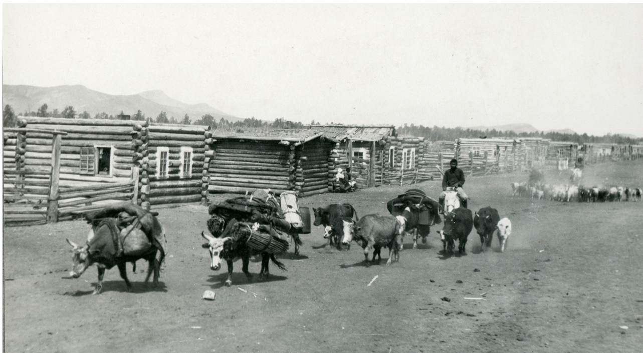
Фото 1. Кочующее аратское хозяйство, п. Торгалык. ТНР, 1930 г. Фото В. П. Ермолаева (НА РТ, ф. 101, оп. 1, д. 3, л. 10) Photo 1. Nomadic Arat farm, village of Torgalyk, TPR, 1930. Photo by V. P. Ermolaev (NA RT, f. 101, op. 1, d. 3, l. 10).

К началу 1930-х гг. территория западных районов Тувы была наиболее плотно заселена тувинцами с развитым кочевым хозяйством и социальными отношениями. По переписи кочевых хозяйств Тувинской Аратской Республики (прежнее название ТНР, далее — ТАР) 1931 г. видно, что общее ко-