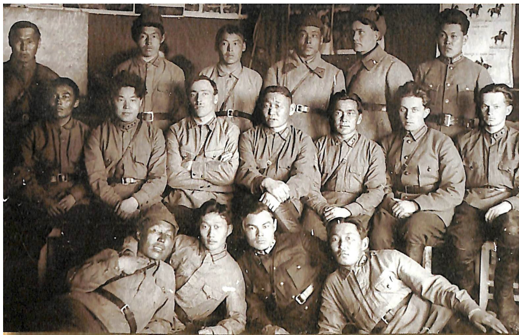
Фото 1. Коллектив УГВПО в 1925 г. ( На защите ... , 2015: 21).