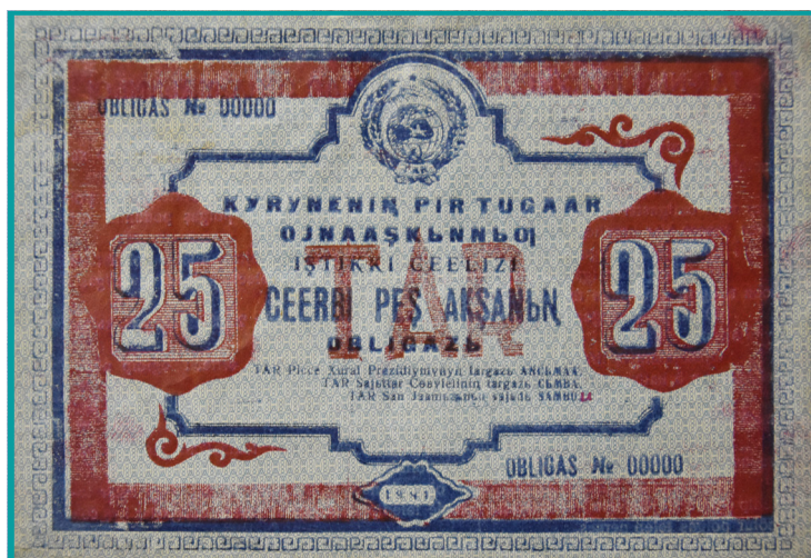
Фото 1. Облигация на 25 акша 1941 г., проект.

Население Тувы с большим энтузиазмом участвовало в приобретении облигаций и уже 26 августа 1943 г. Совет министров ТНР в своем постановлении подвел итоги реализации второго займа в сумме 1 156 430 акша 4 . Благодаря подписке на государственный внутренний займ и сбору наличных денег в фонд обороны СССР было собрано более 2 млн акша (Копеев, 1981: 88). В 1943 г. на средства, собранные с населения и выделенные из государственного бюджета Республики, была куплена и передана Красной Армии авиаэскадрилья «Тувинский народ — фронту» в составе десяти боевых самолетов (Иезуитов, 1956: 124).