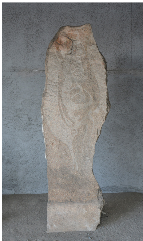
Фото 4. Сайгынская плита (E57). Photo 4. The Saigyn slab (E57).

Таким образом, в тувинском музее хранятся группы каменных памятников различных видов, относящихся к разным временным историческим периодам Тувы. Всего их более 160 единиц, в экспозиции представлены 93. Остальная часть (около 70 камней, а это оленные камни, каменные изваяния, плиты) расположена в хранилище музея.