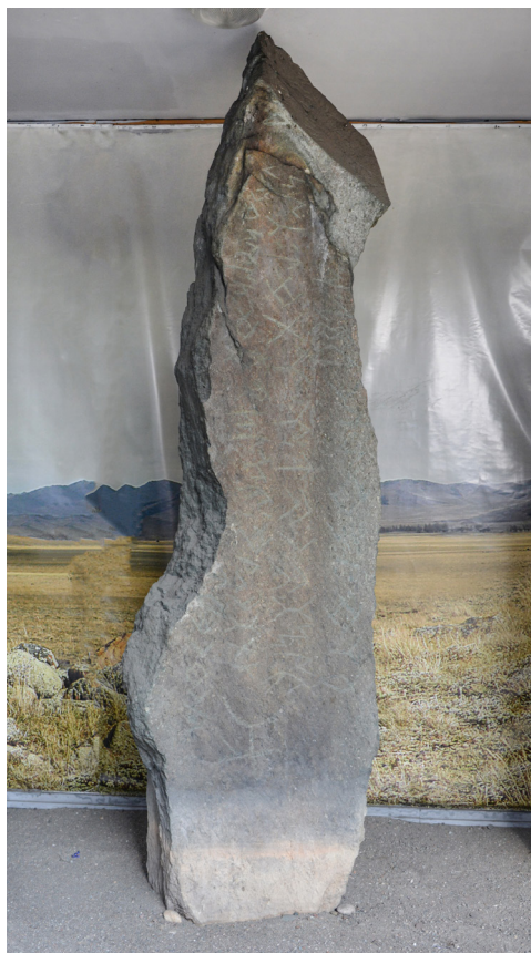
Фото 5. Стела Телээ (Е46). Фото А. Куулар, 2019 г. Photo 5. The Telee stele (E46). Photo by A. Kuular, 2019.

сохранились в современных тюркских языках — Кюлюг-Тириг, Кюни-Тириг ( тириг-дириг — живой), Бай опа ( Бай-бай — богатый), Чочи Бёри ( Бёри — бөрү — волк), Арслан-Кюлюг-Тириг ( Арслан — арзылан — лев), Кочгар ( Кочгар — кошкар — баран), Кара барс ( кара — черный; барс — ирбис), Кюн Чокбе ( Кюн — күн — хүн — солнце) (Кормушин, 2008: 90-166).