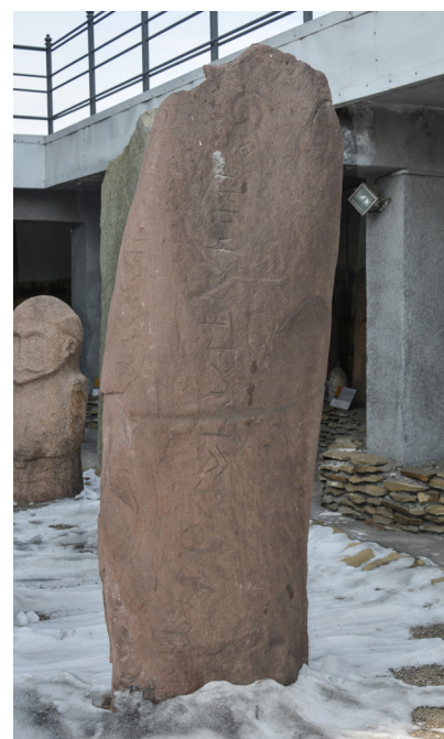
Фото 1-3: 1 — Оленный камень Уюк-Туран (E3); 2. — Оленный камень Уюк-Оорзак (E108); 3. — Оленный камень Элегест III (E53). Фото А. Куулар, 2019 г.