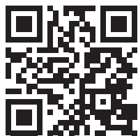
QR-код сайта музея. QR code of the Museum website.

С неизбежностью встает вопрос использования современных технологий при экспонировании предметов. Развитие музейного дела в наше время показывает, что его основа — весьма гибкая (Alexander P., Alexander M., 2008: 10). Музеям необходимо ориентироваться на посетителей — активных пользователей всевозможных гаджетов. И использование в тувинском музее современных технологий также — одна из насущных задач. В настоящее время данная деятельность только начинает получать свое развитие. Помимо использования виртуальных киосков, несложной мультимедийной техники, наш музей в 2019 г. получил «виртуальную копию», т. е. была создана 3D-модель всего помещения с залами. В самих экспозициях используется система QR-кодов, которая позволяет самостоятельно знакомиться с экспозициями.