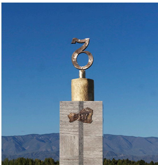
Фото 5. Памятник тувинскому языку на территории филиала НМ РТ «Белдир-Кежии».

В целях реализации упомянутой Концепции в 2015 г. Государственным музеем истории ГУЛАГа также была создана Ассоциация российских музеев памяти, которая объединяет все тематические музеи России, посвященные репрессиям, ГУЛАГу и НКВД (Об ассоциации, Электр. ресурс). Филиал тувинского музея вступил в ряды Ассоциации в ноябре 2017 г. Благодаря членству филиала в Ассоциации 30 марта 2018 г. в стенах Национального музея РТ была открыта выставка «Стена скорби», посвященная проекту создания одноименного мемориального комплекса. Во время открытия выставки был подписан специальный договор о сотрудничестве между Национальным музеем РТ и Музеем истории ГУЛАГа. Отметим, что благодаря соседству Тувы с Монголией, именно наш музей и его филиал рассматриваются коллегами из Музея истории ГУЛАГа, как мост для налаживания связей между музеями репрессий России и Монголии.