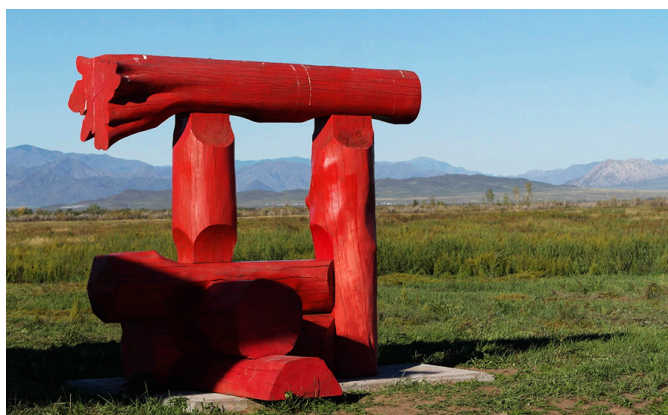
Фото 6. Памятник «Тенгир-Демдее» 2 на территории филиала НМ РТ «Белдир-Кежи». Фото Х. К. Кадыг-оола, 2016 г. Photo 6 Tengir Demdee monument at the Beldyr-Kezhii branch of the National museum, Republic of Tuva. Photo by Kh. K. Kadyg-ool, 2016.

С помощью филиалов НМ РТ производит музеефикацию 1 ценностей, которые создаются в наше время. Так, с 2014 г. в местечке Белдир-Кежи Улуг-Хемского района начал создаваться одноименный этнокультурный комплекс с установленными объектами (фото 5–7).