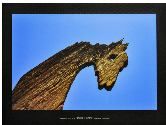
Фото 8. Фрагмент выставки Т. Буркхарда в Национальном музее РТ, 2018 г. Photo 8 Fragment of a Thomann Burkhard exhibition at the National Museum, Republic of Tuva, 2018.

И в этом был определенный месседж для всех участников саммита, стран СНГ и Монголии: руководители вооруженных сил своих стран не являются «свирепыми» военачальниками, которые думают только о войнах, согласно общераспространенным стереотипам. Коллекции НМ РТ и творчество С. К. Шойгу продемонстрировали своеобразный культурный актив, который удалось капитализировать в виде успешного, привлекательного, миролюбивого имиджа республики и страны в целом. Данная интерпретация мероприятия вписывается в концепцию т. н. «мягкой силы» (Nye, 2004: 44). Таким образом, международная деятельность НМ РТ выходит за рамки непосредственно культурно-просветительской деятельности, а имеет все возможности для решения и политических задач.