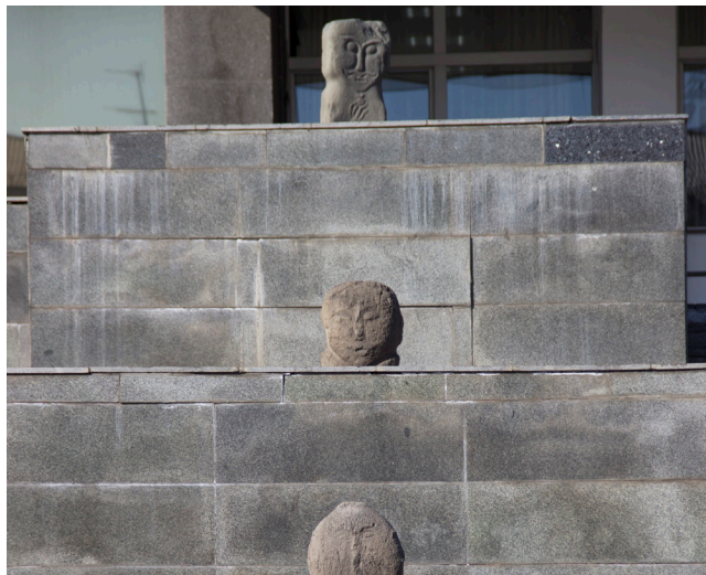
Фото 3 и 4. Скульптуры на боковых нишах лестницы НМ РТ, 2019 г. Photos 3 & 4 Statues in side niches of the National Museum stairway, 2019.

С неизбежностью встает вопрос использования современных технологий при экспонировании предметов. Развитие музейного дела в наше время показывает, что его основа — весьма гибкая (Alexander P., Alexander M., 2008: 10). Музеям необходимо ориентироваться на посетителей — активных пользователей всевозможных гаджетов. И использование в тувинском музее современных технологий также — одна из насущных задач. В настоящее время данная деятельность только начинает получать свое развитие. Помимо использования виртуальных киосков, несложной мультимедийной техники, наш музей в 2019 г. получил «виртуальную копию», т. е. была создана 3D-модель всего помещения с залами. В самих экспозициях используется система QR-кодов, которая позволяет самостоятельно знакомиться с экспозициями.