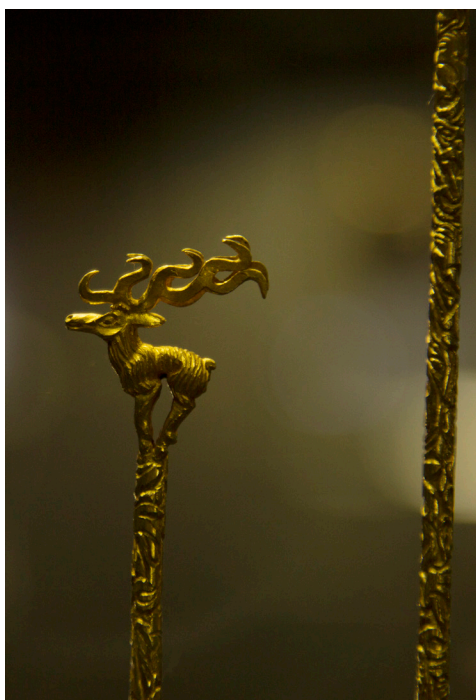
Фото 2. Знаменитая золотая шпилька «царицы» — находка из кургана Аржаан II. Photo 2 The “queen”’s famous gold hairpin. A find from Arzhaan II mound.

В настоящее время основные экспозиции музея размещены в 16 залах на двух этажах в главном здании по адресу г. Кызыл, ул. Титова, д. 30. Отметим, что настоящая структура размещенных выставок нас не удовлетворяет и соответственно мы ставим задачу полной реэкспозиции в залах НМ РТ до 2021 года.