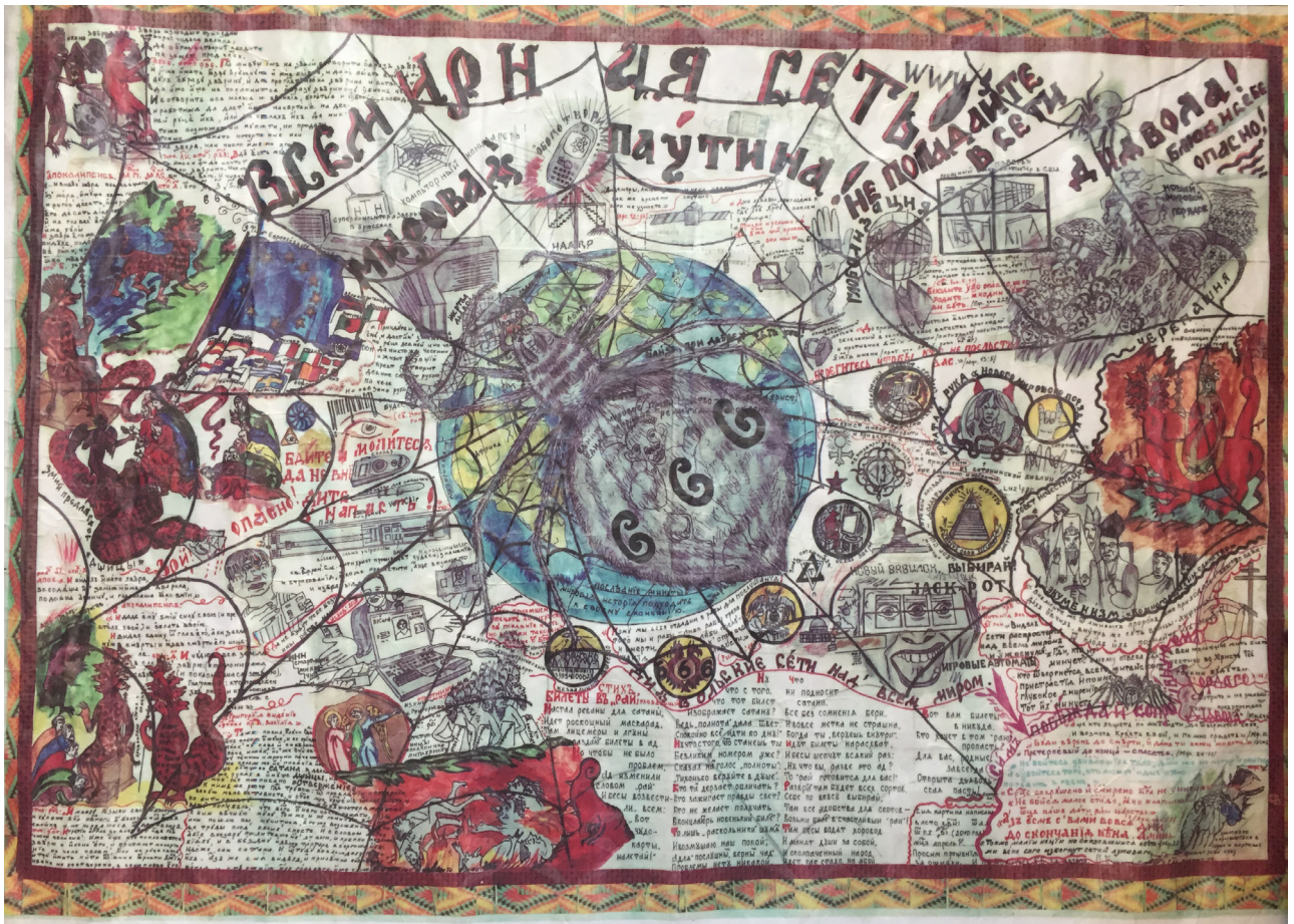
Фото 4. Старообрядческий рисунок «Всемирная сеть. Мировая паутина». Создан на Среднем Енисее (Дубчес). Выявлен в Каа-Хемском районе Республика Тыва. Photo 4. The World Wide Web, the Global Cobweb, a drawing made by an Old Believer at the Middle Yenisei (Dubches). Obtained in Kaa-Khem raion of the Republic of Tuvva.

Сложная визуальная композиция, с большим количеством символов сопровождается текстами из Апокалипсиса и современным старообрядческим духовным стихом «Билеты в “рай” (глобальный)». Приемы конструирования изобразительного поля и игра со словом сближают эти картинки, подчеркивая игровую концепцию лубка (Быкова, Костров, 2018b).