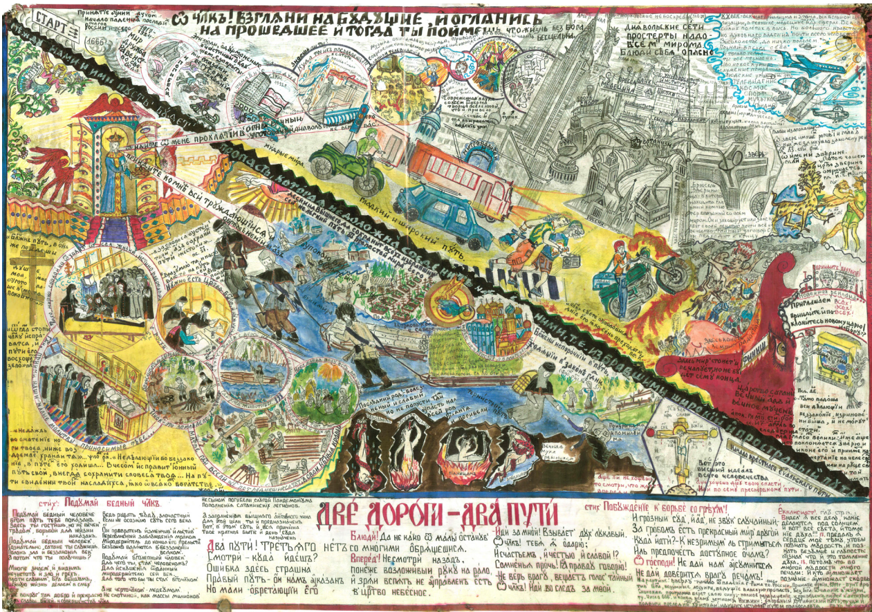
Фото 3. Старобрядческий рисунок «Две дороги — два пути», создан на Среднем Енисее (Дубчес).

Выявлен в Каа-Хемском районе Республика Тыва в 2016 г.