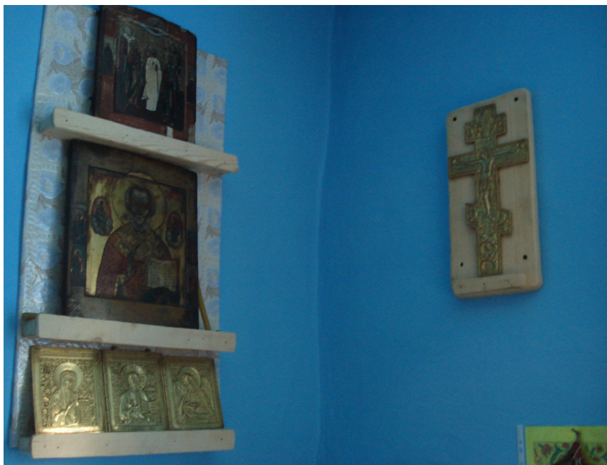
Фото 1. Красный угол в частном доме старообрядцев-часовенных. Каа-Хемский район. Фото А. Пригарина, 2016 г. Photo 1. "Red corner" in a private house of Chasovennye Old Believers. Kaa-Khem raion. Photo by A. Prigarin, 2016.

При обследовании частных домов фиксируется, что на полях икон написаны патрональные святые: св. Евдокия, св. Андрей, св. Евстафий, св. Иоанна воин и Ангел-хранитель. В красном углу старообрядца находятся как живописные иконы, так и металлопластика в виде складней и отдельных небольших образов с избранными святыми, как правило, патрональными (фото 1). При