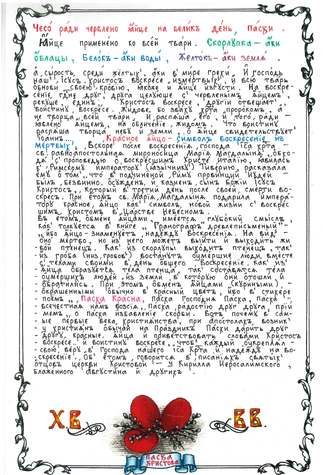
Фото 6. Старообрядческий рисованный лист «Чесо ради червлено яйце на велик день, Пасхи».