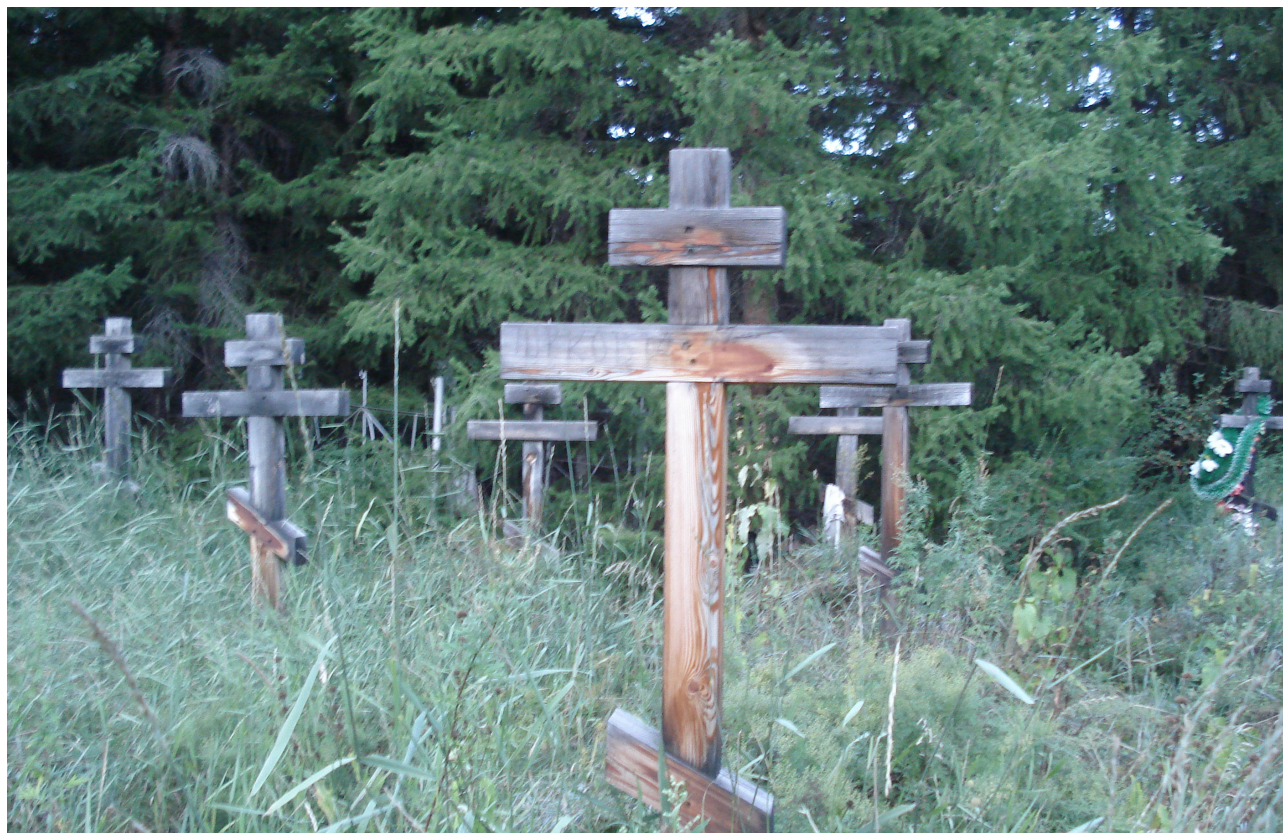
Фото 2. Староверческое кладбище. Сизим. Каа-Хемский район. Photo 2. Old Believers Cemetery, Sizim, Kaa-Khem raion.

В традиционных представлениях старообрядческая культура — это культура слова и книги. Старообрядческая книга отличается особым художественным оформлением: книжные переплеты из кожи с тиснением и застежками, орнаментальные заставки, книжные миниатюры, буквицы и шрифты. Все эти элементы художественной структуры книги подчеркивают особую эстетику, формирующую визуальное жизненное пространство старообрядцев, наполняя его сакральными символами. Книжно-рукописное мастерство, получившее распространение в старообрядческих скитах Тувы и Красноярского края, является одним из визуальных каналов распространения сакральной знаковой системы в локальных общинах. Известный исследователь старообрядческой книжности Н. Ю. Бубнов, определяя старообрядческую книгу как историко-культурный феномен, отмечает, что «старообрядческая книга, искусственно оторванная от типографий, являлась по существу постпечатной книгой, обладавшей целым набором признаков, свойственных печатной книге. Создатели рукописных книг не только стремились придать внешнее сходство с печатной книгой, копируя “полууставный” шрифт, заставки и инициалы печатного книжного орнамента, переплеты Печатного двора, но и начиная с 1667 г. стали называть составленные ими рукописные сборники книгами, стремясь в глазах читателей уравнивать их в правах с официальными печатными изданиями» (Бубнов, 1995: 39).