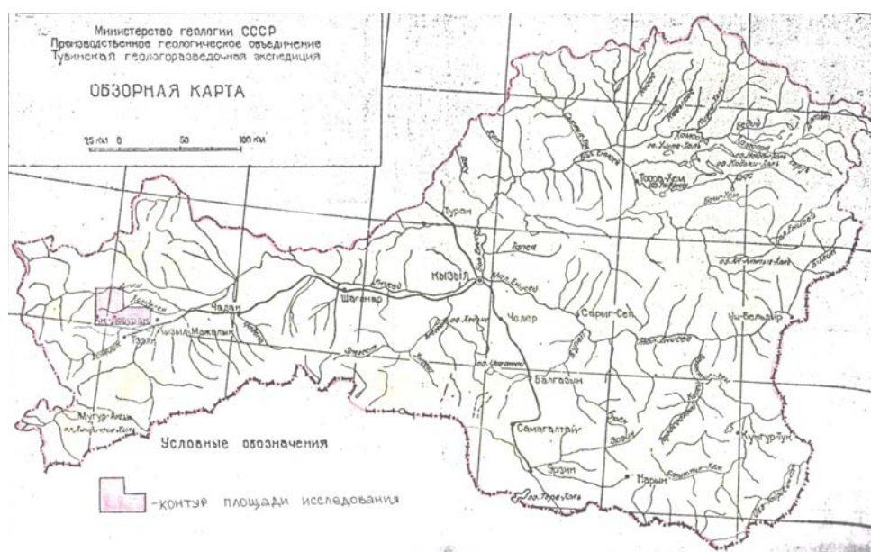
Рис. 1. Обзорная карта расположения площади исследования (Геология СССР, 1966: 8). Fig.1. An overview map of the research area (Geologiya SSSR, 1966: 8).

ственного университета в рамках выпускной квалификационной работы (Хертек, 2001). А данная статья представляет собой ее сокращенный и немного доработанный вариант 1 .