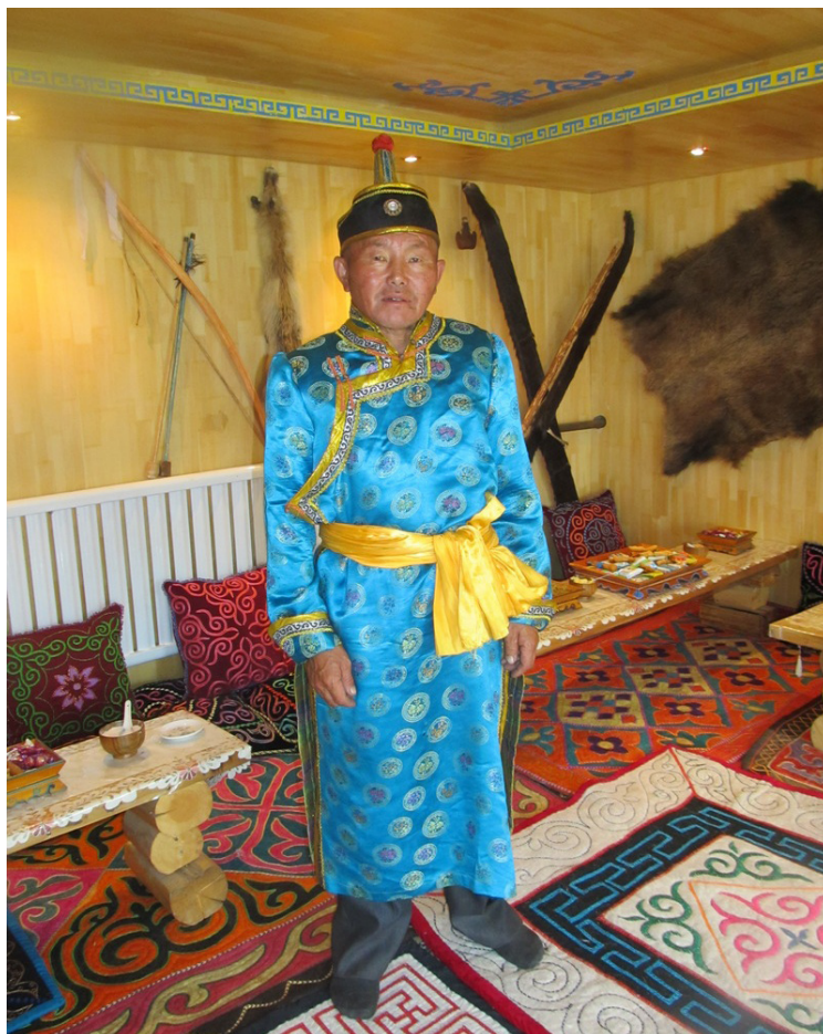
Фото 4. Тувинец, демонстрирующий туристам национальную одежду (2013 г.).

В ноябре 2015 г. местные активисты обратились к музыкантам из Тувы обучить их искусству горлового пения и пригласили преподавателя-горловика. Приехал артист Национального оркестра Тувы Начын Шалык, который обучал желающих в течение месяца. Затем его сменил Радик Тюлюш, музыкант известной этногруппы “Хун-Хурту”, поработавший здесь в течение трех недель. Обучившиеся