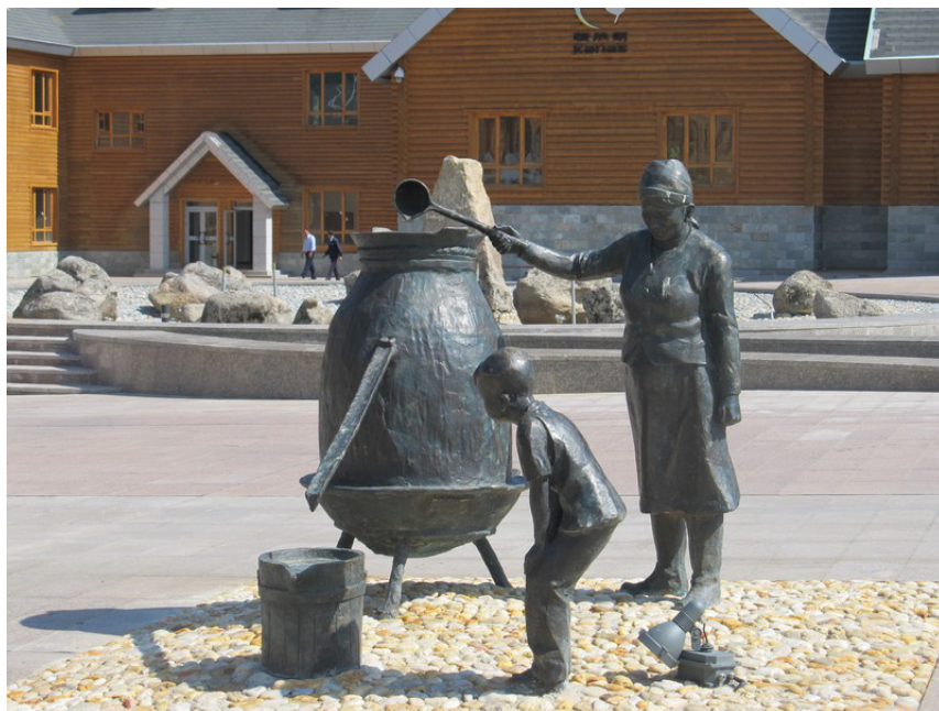
Фото 3. Скульптурное изображение, изображающая сцену изготовления молочной араги (2014 г.).

До 2014 г. частные компании, обслуживающие туристов, ежегодно выдавали местному населению (каждому члену семьи) денежные пособия, с тем условием, чтобы они не открывали в своих домах гостиницы для туристов. Считалось,