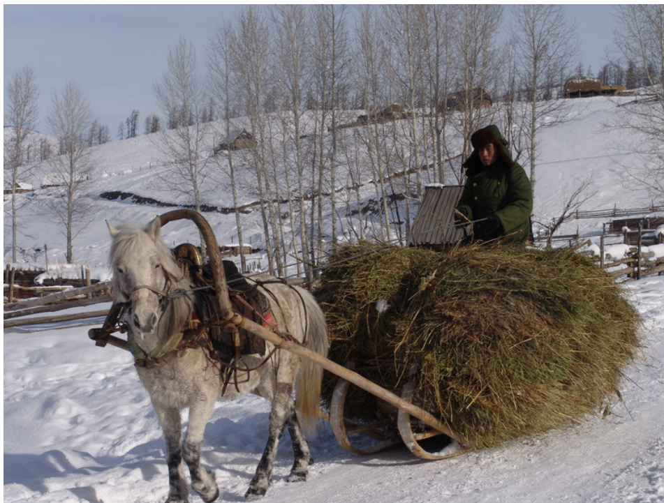
Фото 2. Заготовленное сено используется зимой. В селениях тувинцев часто можно увидеть подобную картину (2010 г.). Photo 2. Hay is made in the summer and used during winter. Scenes like this are typical for Tuvan villages (2010).

У ч и т ы - вая природно-климатические условия региона, в отличие от российских и монгольских тувинцев, здесь не держат верблюдов и яков-сарлыков. Наибольшее развитие в скотоводстве получило разведение лошадей и крупного рогатого скота, поскольку зимы здесь снежные, осадков выпадает до 2–3 метров, что трудно для содержания большего количества мелко-рогатого скота.