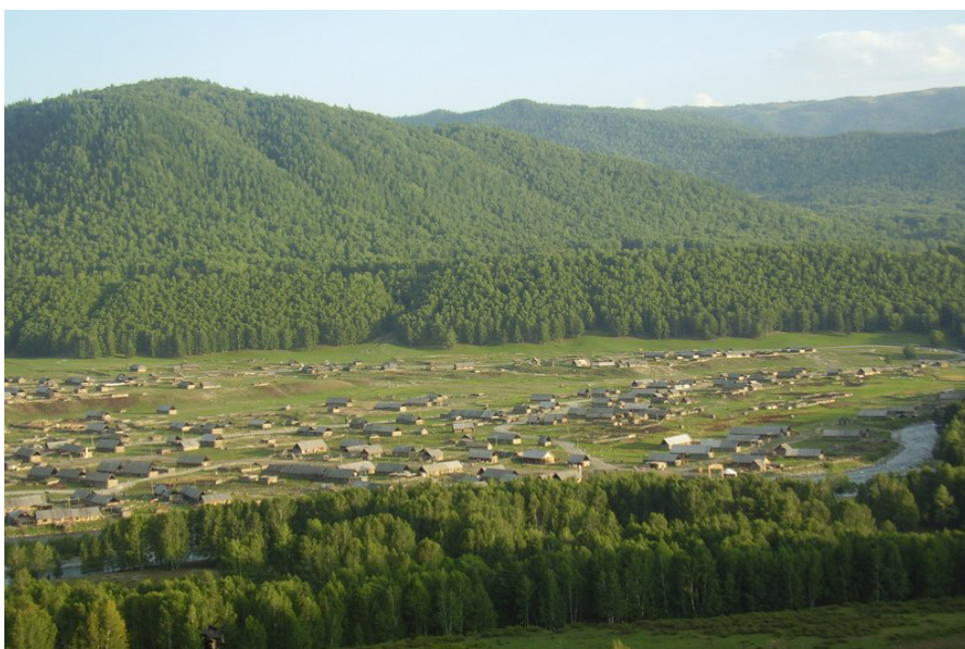
Фото 1. Деревня Хом, где проживает тувинское население (2010 г.).

вошла в их состав (Абрамзон, 1961: 121). Кроме этого, отмечаются зафиксированные случаи вхождения иных этносов и в родоплеменной состав китайских тувинцев. По рассказам наших информантов, в начале XX в. из Горного Алтая, спасаясь от советской власти, в Китай перекочевали представители алтайских сеоков, которые ассимилировались с китайскими тувинцами, их потомки не знают алтайского языка, считают себя тувинцами, хотя помнят, что их предки пришли с Алтая.