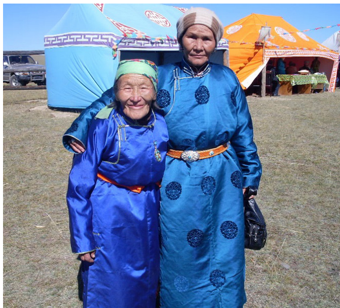
Фото 4. Ветераны оленеводы после получения Государственной награды. Цагаан-Нуур, 2011.

Цаатаны почитают родовой семейный очаг и поддерживают традиции тувинского гостеприимства. Любого гостя, пришедшего в их жилище, обязательно угощают горячим чаем с молоком. За чашкою чая принято расспрашивать друг у друга о жизни, семье и здоровье, также обмениваются последними новостями. Цаатанами соблюдаются традиционные праздники по лунному календарю. Так, они встречают Шагаа — новый год по восточному календарю 12-летнего животного цикла. Он отмечается ежегодно в период от 21 января по 20 февраля по европейскому календарю.