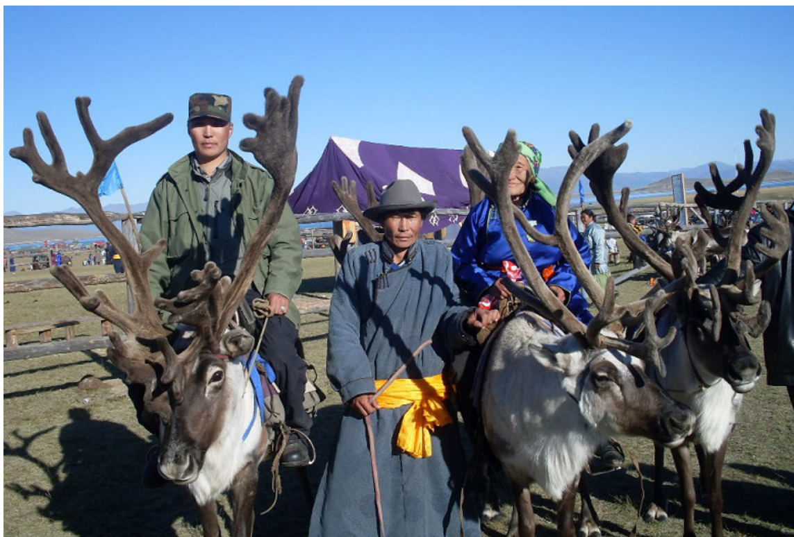
Фото 1. Парад цаатанов-оленеводов во время празднования Наадыма. Цагаан-Нуур, 2011.