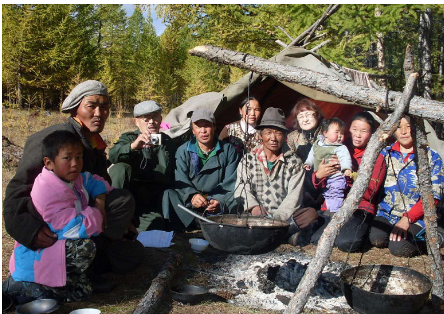
Фото 2. Временная стоянка цаатанов. После работы с информантами. Близ сумона Цагаан-Нуур, 2011.

Основным видом хозяйственной деятельности тувинцев-цаатанов является разведение таежных оленей. Оленеводством в аймаке занимается исключительно субэтническая группа тувинцев.