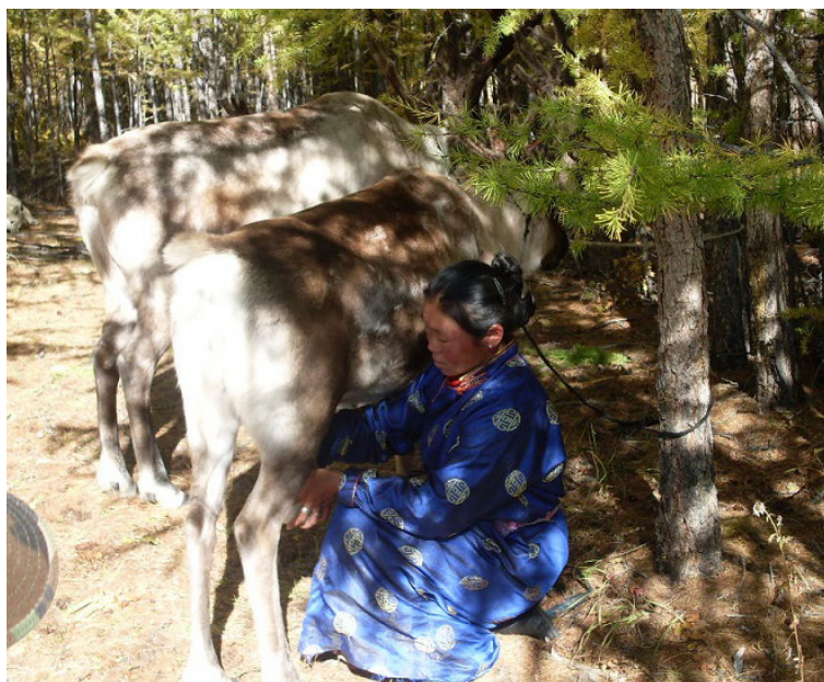
Фото 3. Время дойки оленя.

Все имущество перевозится на оленях. Поэтому домашняя утварь очень