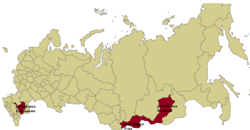
Рис 1. Буддистские регионы России

Буддизм в России провозглашён одной из четырёх традиционных религий, наряду с православием, исламом и иудаизмом. Традиционными регионами, исповедующими буддизм, являются: Калмыкия, Бурятия, Тува (см. рис. 1), а кроме них: Республика Алтай, Забайкальский край и Иркутская область.