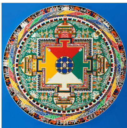
Рис. 2. Классическая буддийская мандала.

Если подробно изучить вышеуказанную эмблему, то можно прийти к выводу, что она схематически похожа на мандалу (см. рисунок 2). Расположение и цвета основных эмблем герба дает основания предположить семантическую параллель между гербом 1935 г. и знаком мандалы.