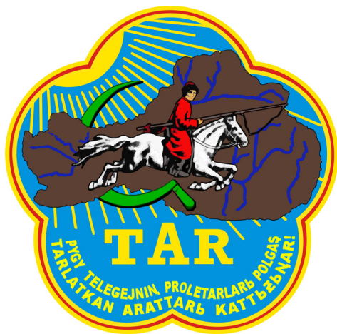
Рис. 1. Герб Тувинской Народной Республики 1935–1939 гг.

Другое описание нового герба и флага мы видим в проекте Конституции ТНР 1936 г. В 67-й статье данного проекта Конституции говорится: «Государственный герб республики состоит из изображения на голубом фоне пятиконечной тупой звезды контура территории республики серо-коричневого цвета, по которым изображен мчащийся на бело-серой лошади всадник-арат с красным шестом на руках в темно-синем национальном костюме с черной нацио-нальной обуви, обращенный лицом к востоку. С северо-запада освещает солнце, с юго-запада на север лежит серп зеленого цвета, внизу герба надпись желтого цвета “ТАР” и “Пролетарии всех стран и угнетенные народы всего мира, соединяйтесь!”» (Конституции ... , 1999: 74: здесь и далее орфография и стилистика цитируемых документов сохранены. — Б. М.).