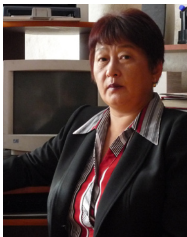
М. С. Маадыр

Аннотация: В статье представлен обзор диссертационных исследований врачей Республики Тыва, защищенных ими в период с 1968 по 2012 гг.