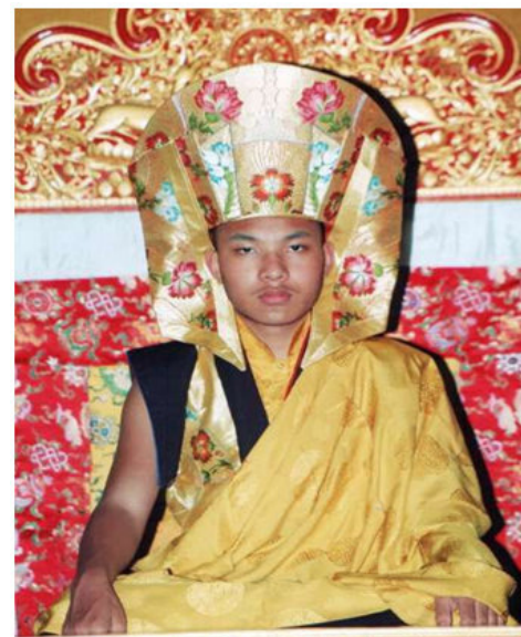
Кармапа, которого признал Далай-лама XIV