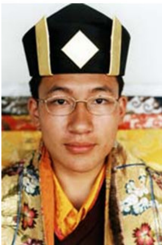
Кармапа, которого выдвинул Оле Нидал

Имя Кармапа в России произносят с придыханием, потому что понимают, что речь идет о тибетском мастере высокого уровня. Но вряд ли все в курсе, что существуют два Кармапы. Оба они тибетцы, оба молоды, каждый претендует на то, чтобы считаться духовным лидером традиции карма-кагью тибетского буддизма. Но двух глав в одной традиции не бывает, поэтому идет горячий спор, больше носящий политический характер, нежели духовный, кто же из них является настоящим держателем линии преемственности.