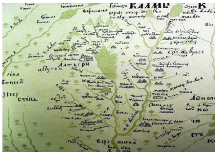
Рис. 2. Фрагмент карты (лист 20) «Чертеж земли всей безводной и малопроездной каменной степи» из «Чертежной книги Сибири».

На карте «Чертежа сходства и наличия земель всей Сибири Тобольского города и всех разных городов и степей» у истоков Енисея землями «Уранхайска» и «Саянска» обозначена территория со-