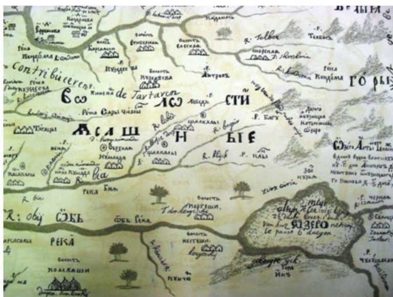
Рис. 3. Фрагмент карты (лист 12) «Чертеж Кузнецкого города» из «Чертежной книги Сибири».

Информация о расселении отмеченных групп в «Чертежной книге...» соотносится со сведениями в источниках XVII в., опубликованными в XVIII столетии в «Истории Сибири» Г. Ф. Миллером. Это данные о керсагалах в районе рек Катуня и Бии (Миллер, 2000: 622) и о переселившейся в сторону Алтая группе соян, известной как саянцы (там же: 622; Путешествие через