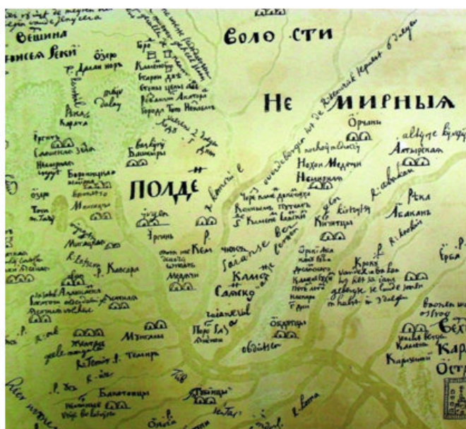
Рис. 1. Фрагмент карты (лист 15) «Чертеж земли Красноярского города» из «Чертежной книги Сибири».

На другой карте — «Чертеже земли всей безводной и малопроездной каменной степи» — в райо-