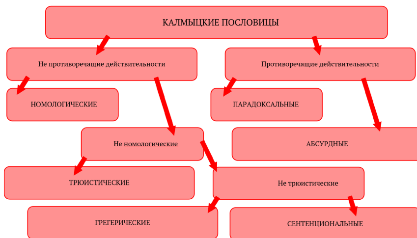
Рис. 1. Когнитивно-семантические категории (типы) пословиц калмыцкого языка по отношению их содержания к действительности.

Исследование калмыцких пословиц показало, что в них представлены все аспекты провербиальной категоризации действительности, в соответствии с которыми пословичная семантика дифференцируется на когнитивно значимые категории: номологическая и сентенциальная (в эмпирическом аспекте), трюистическая и грегерическая (в аксиологическом аспекте), парадоксальная (в логическом аспекте) и абсурдная (в онтологическом аспекте).