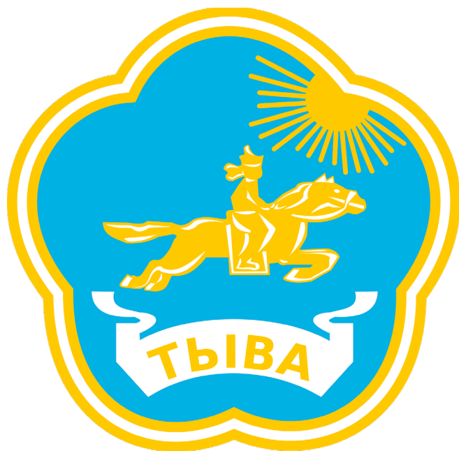
Рис. 7. Герб Республики Тува 1992 г. Fig. 7. The coat of arms of the Republic of Tuva, 1992.