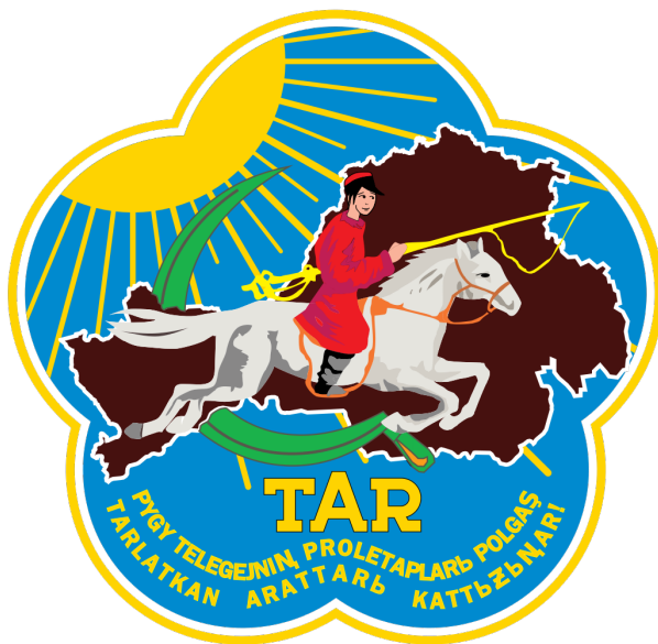
Рис. 6. Герб Тувинской Народной Республики 1935–1939 гг. Fig. 6. The coat of arms of the Tuvan People's Republic, 1935–1939.

«Левый» эксперимент привел к росту народного недовольства. Внутренняя политика была откорректирована, принят «новый политико-хозяйственный курс», аналог советского НЭПа, советская идеология ослаблена. Буржуазно-демократические реформы отразились в новой Конституции 1936 г., оставшейся не утвержденной. Однако в символической политике изменения были более явными.