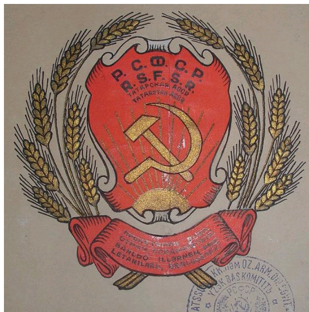
Рис. 2. Герб Татарской АССР, 1926 г. (утвержден ЦИК Совета рабочих, крестьянских и солдатских депутатов Автономной Татарской ССР). Fig. 2. The coat of arms of the Tatar ASSR, 1926 (approved by the Central Executive Committee of the Council of Workers', Peasants' and Soldiers' Deputies of the Autonomous Tatar SSR).