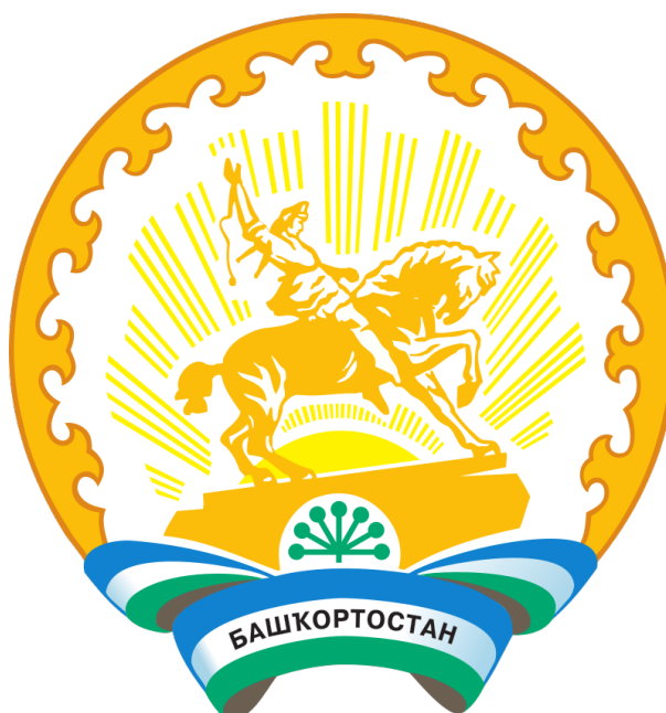
Рис. 8. Герб Республики Башкортостан 1993 г. Fig. 8. The coat of arms of the Republic of Bashkortostan, 1993.

В официальном пояснении символики герба уточнялось, что всадник на гербе — арат-крестьянин-скотовод, олицетворяющий самобытность тувинского этноса, традиционный уклад жизни и основную хозяйственную деятельность. Он одет в национальный костюм и головной убор, который носили предки тувинцев. Само изображение всадника, скачущего навстречу лучам солнца, символизировало движение к светлой и счастливой жизни, миру, высоким идеалам. Кадак — церемониальный шарф, который преподносится как почетный дар, выражает гостеприимство и дружелюбие тувинцев. Пятилепестковый щит — стилизованный древнебуддийский знак вечности (Сат, Иргит, 2013: 415). Герб Тувы во многом повторял герб ТНР 1935 г. Таким образом, геральдика Тувы вернула свой основной символ — образ всадника в лучах солнца.