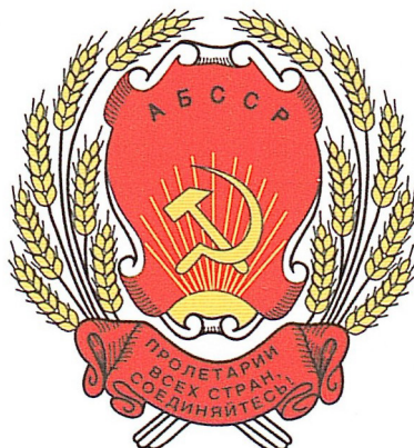
Рис. 4. Герб Автономной Башкирской Социалистической Советской Республики 1926 г.

Fig. 4. The coat of arms of the Autonomous Bashkir Socialist Soviet Republic, 1926.