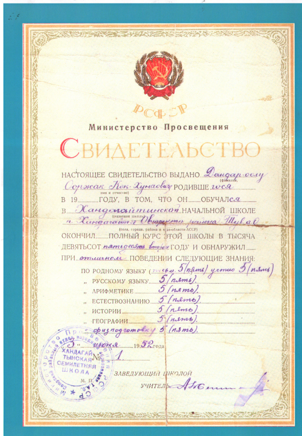
Фото. 2. Свидетельство об окончании Хандагайтинской начальной школы, 1952 г. (НА РТ, ф.п-395, оп. 1, д. 16, л. 1).

Таким образом, автобиографии достаточно полно раскрывают происхождение, дают информацию об образовании, основных этапах трудовой деятельности, наградах, семье и творчестве Д. К.-Х. Ооржака, что соответствует стилю и назначению документов данного вида.