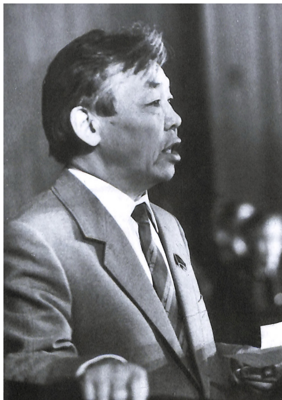
Фото 1. Первый секретарь Тувинского обкома КПСС Григорий Ширшин, 1980-е гг.