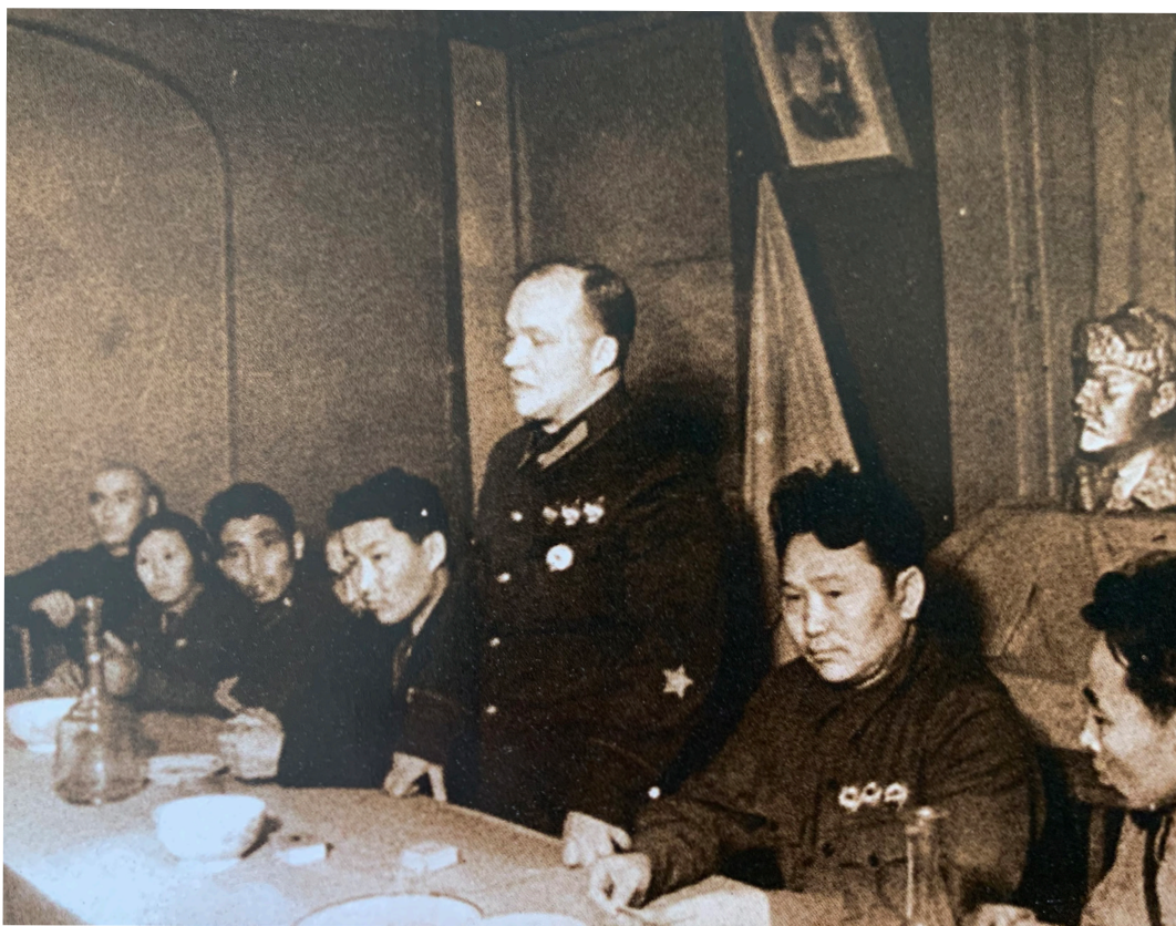
Фото 8. Западный фронт. 1942 г.