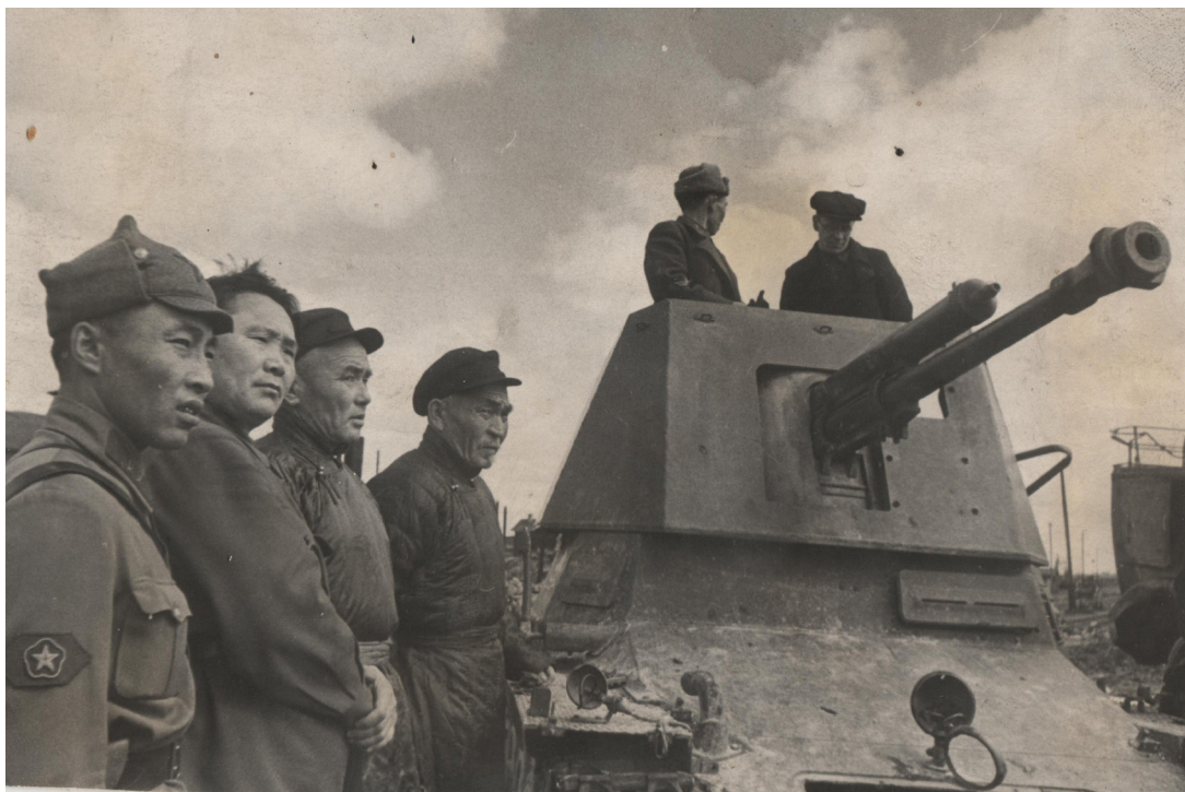
Фото 7. Осмотр трофеев в Можайске (НА РТ, фп. 357, оп. 1, д. 67).

Затем делегация отправились вглубь к передовым частям Красной Армии западного фронта.