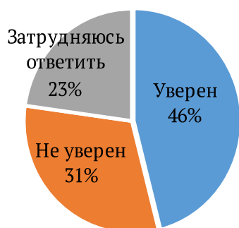
Диаграмма 1. Степень уверенности респондентов в своем будущем. Diagram 1. The degree of respondents' confidence in their future.

Как видно из диаграммы 1, почти половина респондентов уверена в своем будущем (в позитивных перспективах). Это 66% чеченцев, 48% даргинцев, 50% табасаранцев; еще одна треть заявила о своей неуверенности в завтрашнем дне (кумыки — 42,2%, недагестанские народы — 44,2%, русские и малочисленные народы Дагестана по 41,7%), почти четверть опрошенных затруднились с ответом.