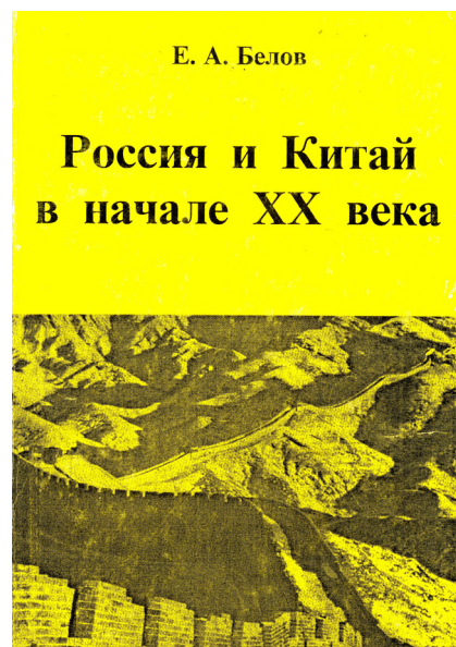
Фото 2. Обложка монографии Е. А. Белова «Россия и Китай в начале XX века (русско-китайские противоречия в 1911–1915 гг.)». М.: ИВ РАН, 1997. Photo 2. The cover of E. A. Belov's book "Russia and China at the beginning of the 20th century: Russian-Chinese contradictions, 1911–1915" Moscow, IV RAN, 1997.